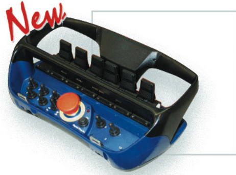
Scanreco multifunction radio control. Radiocontrol multifunción Scanreco.