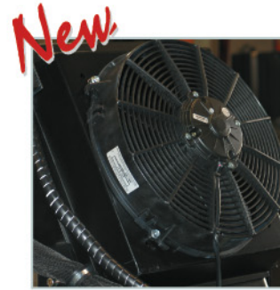
Heat exchanger. Cambiador de calor.